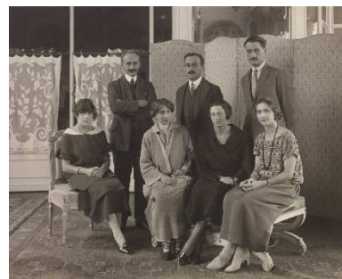
Le secrétariat général de la SDN