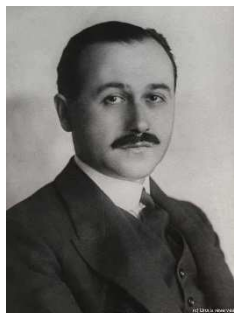
Jean Monnet en 1922

La Fondation Jean Monnet pour l'Europe a retrouvé 2 mètres linéaires de documents de Jean Monnet datés de 1916 à 1922 et présumés disparus.