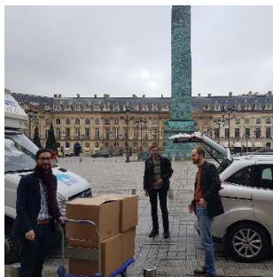
L'expédition à Paris