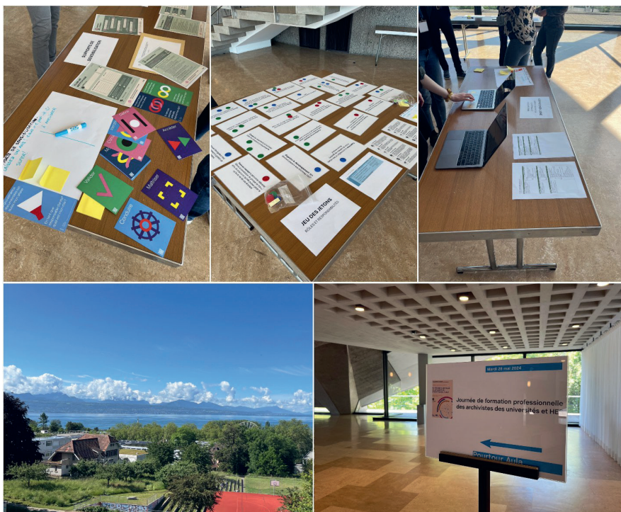
28 mai 2024

Cette présentation a également offert aux archivistes présents l'opportunité d'explorer des outils pratiques et des exemples d'activités pédagogiques, qu'ils pourront s'approprier, adapter ou réinventer selon leur propre contexte professionnel.